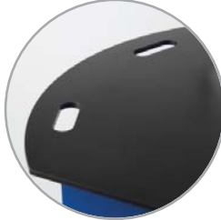
مقابض مجوّقة منمنجة