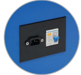
مصدر طاقة محمي يعمل بالتيار المتبقي