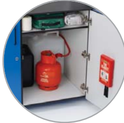
مكان لتخزين أنبوب الغاز