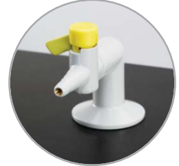
صنوبر غاز فردي قياسي للمعامل