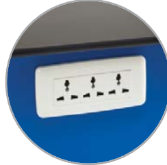
مقابس إخراج متعددة