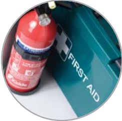
صندوق إسعافات أولية وطفلية حريق أو بطارية حريق