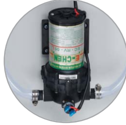
Bomba de agua resistente