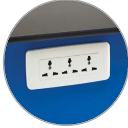
Enchufes de salida múltiple