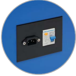
Suministro eléctrico con protección DDR