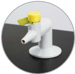
Llave de gas individual convencional de laboratorio

Cada carro de ciencias viene totalmente equipado con una fuente de alimentación eléctrica con protección DDR alimentada desde una conexión externa IEC. Tiene un suministro de agua regulado por presión que conduce a un grifo estándar de laboratorio con cuello de cisne con fregadero integral y contenedores para agua potable y de desecho. Se suministra una toma de gas única desde un cilindro de gas interno.