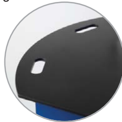
Asas para manejo integral