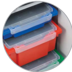
Cajones extraíbles con codificación de color