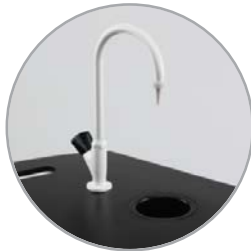
Grifo de agua y pila convencional de laboratorio