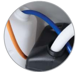
Sistema de gestión de agua