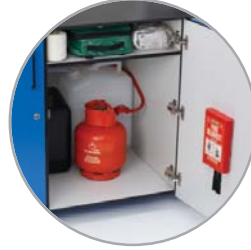
Espacio para guardar la botella de gas