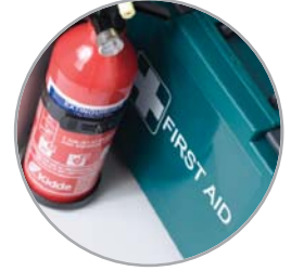
Botiquín de primeros auxilios y Extintor de incendios/Manta contra incendios